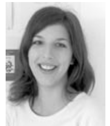
A pályázat boldog nyertese

Az új címkét viselő egyedi palackokkal november 11-től, Szent Márton napjától találkozhatnak az éttermekben, szaküzletekben, valamint pincészetünknel.