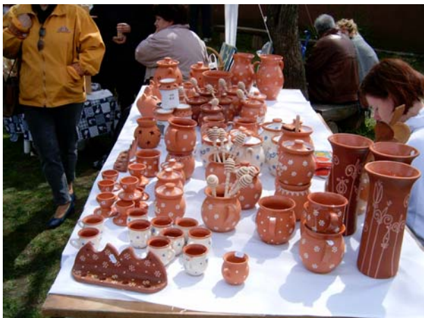
21. kép: Fazekasmunkák