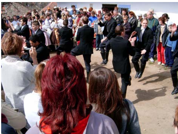
11. kép: Húsvét, 2004