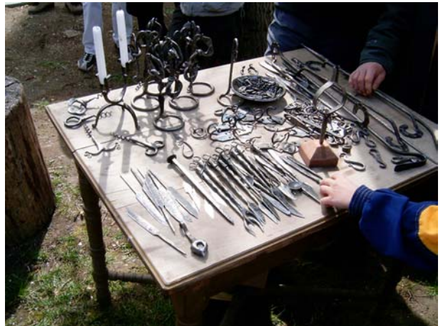
16. kép: A helyben készült dísztárgyak