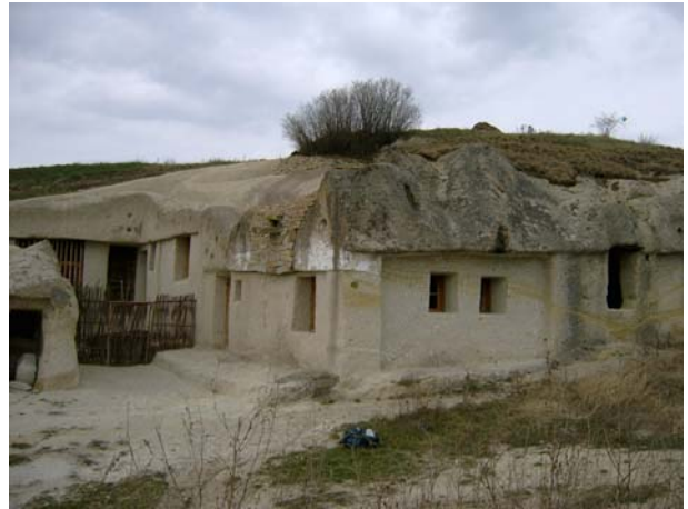
2. kép: Felújított barlanglakás