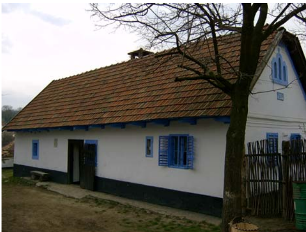
3. kép: A Noszvaji Gazdaház