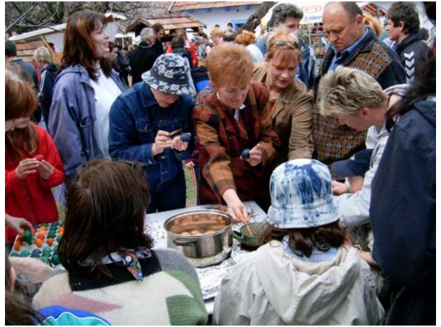
14. kép: Húsvéti tojásfestés