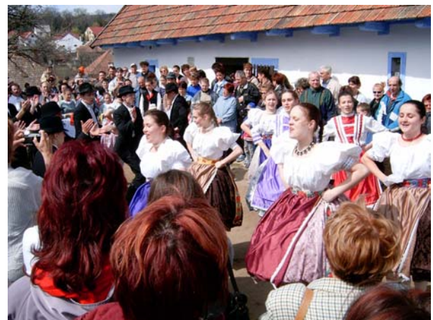
12. kép: Néptáncosok a Gazdaház előtt