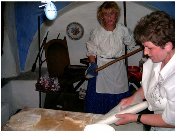
17. kép: Húsvéti kalácsütés