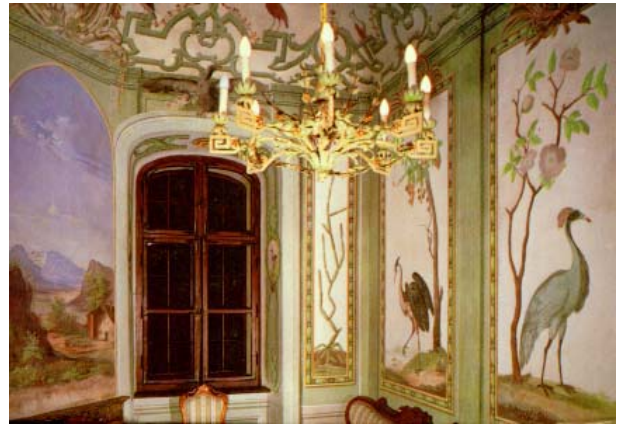
8. kép: Madaras szoba