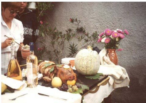
22. kép: Kemencében sült ételek versenye