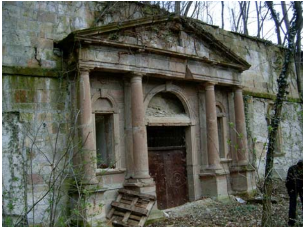
9. kép: Galassy-kripta