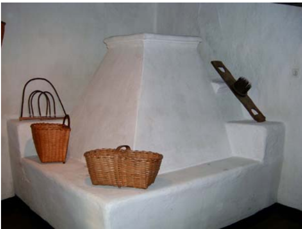
5. kép: Egy működő kemence a Gazdaházban