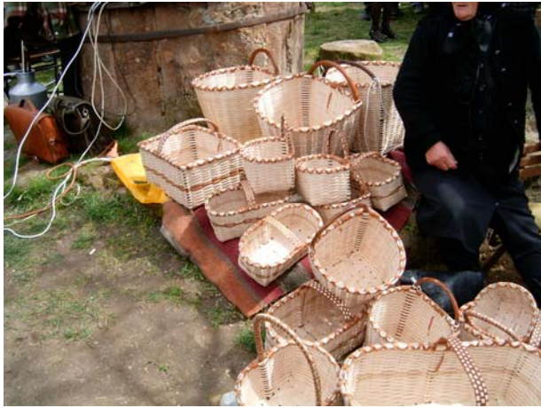
13. kép: Háti-kosarak