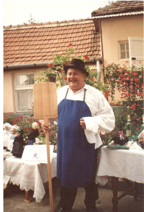
23. kép: A verseny győztese a vándor-sütőlapáttal