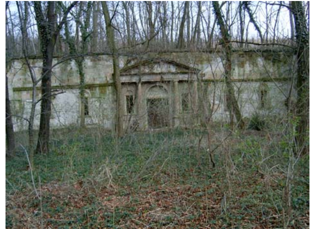
10. kép: Galassy-kripta