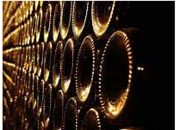
20. kép: Borban az igazság...