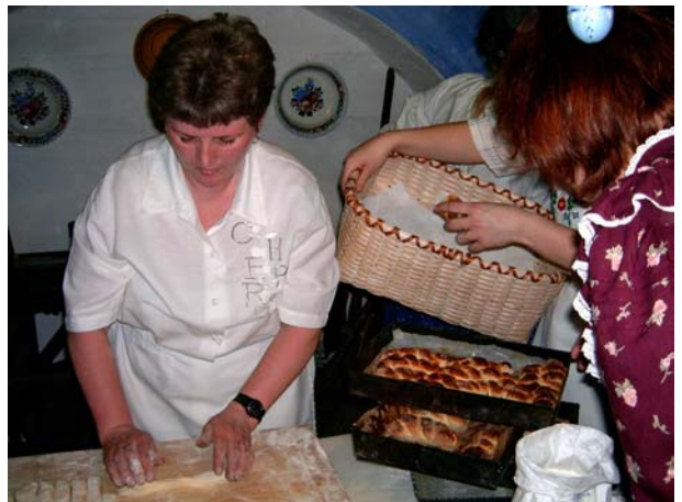
18. kép: Kalácsfonás