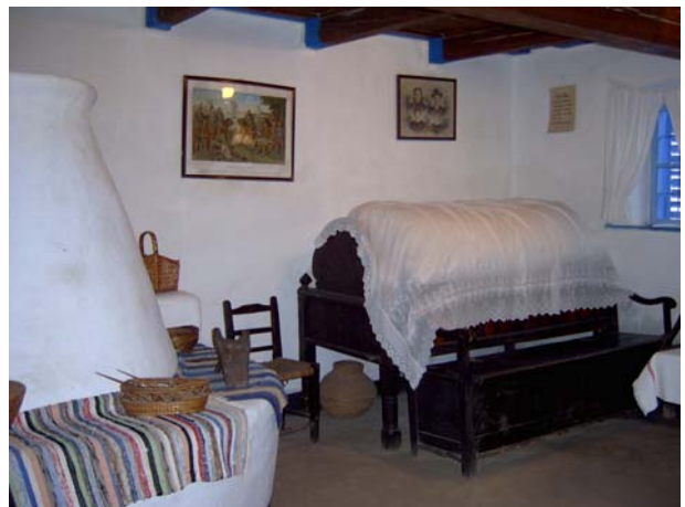
4. kép: A Gazdaház tisztaszobája