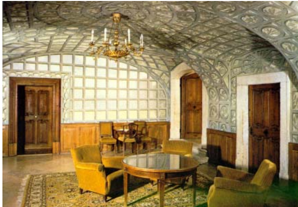
7. kép: Sala terrena