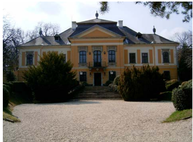
6. kép: A de la Motte Kastély