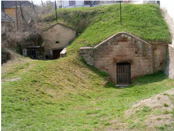
19. kép: Noszvaji pince