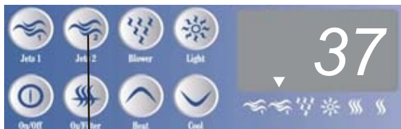
Jets 2 gomb