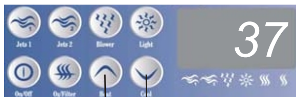
Heat és Cool gombok

A vízhőmérsékletet 1°C-onként lehet állítani 15°C és 40°C között.