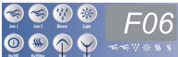
Heat és Cool gombok